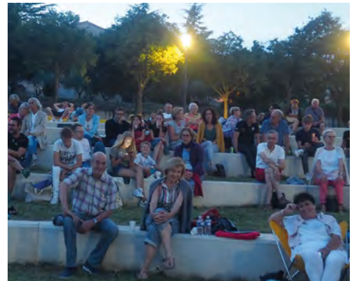
Une partie du public, en attendant le film...