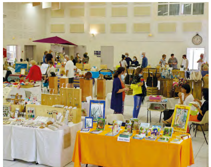
Une partie des exposants pendant la pause déjeuner