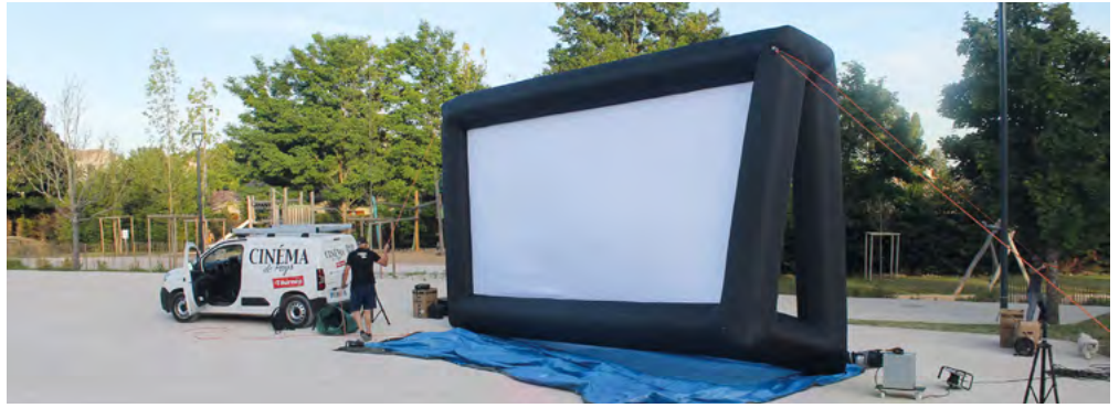
Montage de l'écran

Pour ces deux événements, une buvette était organisée au profit du CCAS de la Commune.